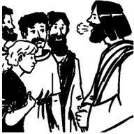
Grafik: Ulrich Loose

1. Lesung: Apostelgeschichte 2,1-11 2. Lesung: 1. Korinther 12,3b.7.12-13